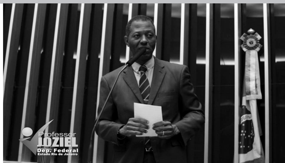
Deputado Federal Professor Joziel - PSL RJ

Por isso, o desenvolvimento de políticas públicas para a questão ambiental é urgente. Se a sociedade civil e os governantes, tratassem com visão preventiva, certamente sofreríamos menos impacto negativo ambiental em uma sociedade próspera como a nossa. Na Câmara dos Deputados, quero trazer discussão e ação efetiva para que a sustentabilidade seja uma das prioridades nesse Parlamento. Não podemos mais negligenciar a maior riqueza que temos: o meio ambiente. Vamos, abordar, por exemplo, a geração de energia limpa e renovável, o consumo consciente da água potável e seu reaproveitamento e o desenvolvimento econômico sustentável," afirmou. As comissões são órgãos técnicos criados pelo Regimento Interno da Câmara e constituídos de deputados, com a finalidade de discutir e votar as pro-