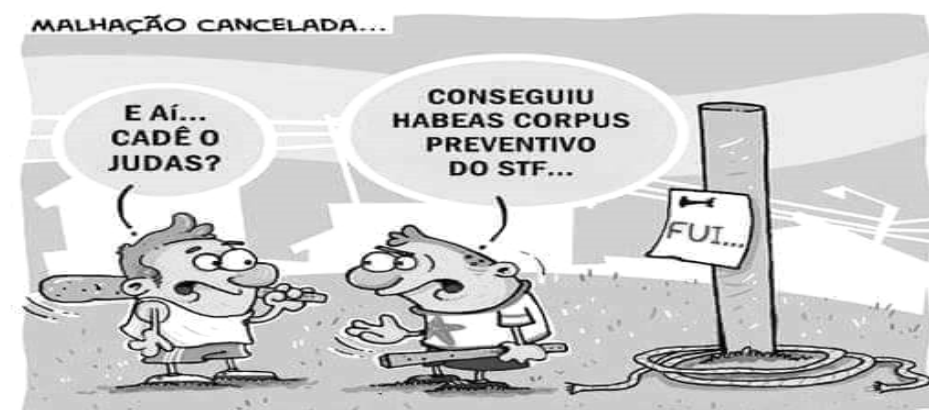
A charge da edição escolhida pela redação