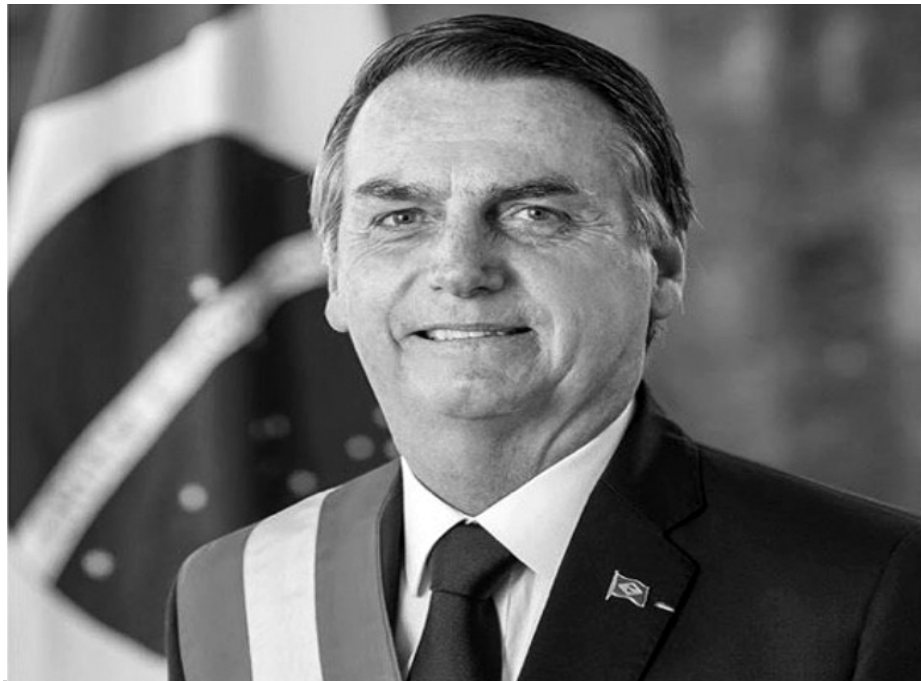
Presidente Jair Bolsonaro

Em quanto pesquisas, atualmente sem quaisquer credibilidade, são realizadas pelos Institutos Ibope e o Datafolha, apresentam uma vertiginosa queda de índices da popularidade do presidente Jair Bolsonaro, uma outra pesquisa, fechada no dia 9 de abril mostra um resultado totalmente diferente. A pesquisa realizada pelo “Instituto Sargentis” com a participação de 7.000 internautas abrangendo todos os estados da Federação, revela que a aprovação do presidente Jair Bolsonaro esta em 72% pontos percentuais e enquanto a reprovação ficou em 28%. Segundo o site Metrópoles “nas pesquisas tradicionais, ao vivo ou por telefone, com amostras por cotas, o objetivo e refletir como uma “espelho” a composição, demográfica da população. Nesses casos, tenta-se conhecer a opinião de toda população a partir da representatividade dos, sub grupos populacionais dentro da amostra na pesquisa. Já na metodologia empregada no estudo online do Instituto Sargentis , o objetivo e permitir o máximo de participação possível. Assim, a cada, novo participante que convida seus conhecidos, a abrangência dos resultados aumentam. A medida que a amostra cresce, o acumulo de dados se torna util para a pesquisa. Mais de 7 mil pessoas participaram da recente amostra”.