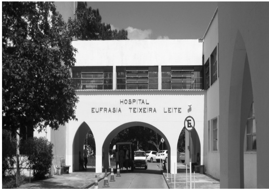
hospital filantropico com o busto da fundadora da entidade